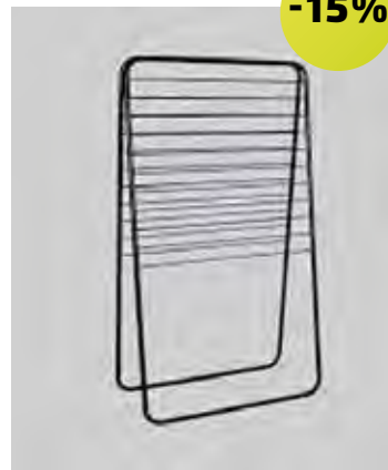
Expositor chão Papel Fantasia Duplo | 14549 740 x 380 x 1325 mm