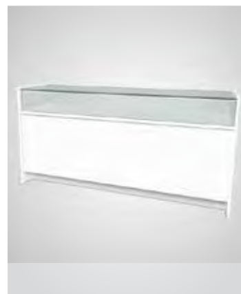
Balcão montra baixa

Móvel em aglomerite branca, com tampo e pequena frente em vidro, para exposição. 1000x550x900mm