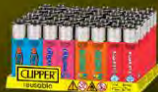
Cód. 501736-98 Algarve 2023