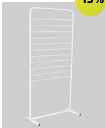
Expositor chão Papel Fantasia Simples | 14550 755x330x1570 mm