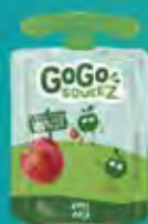
Sabor Maçã Cód. 51134