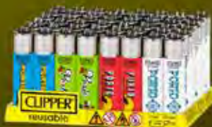
Cód. 501736-97 Porto 2023