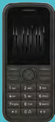
MobiWire F3 DS €19,99

Código: 53240 Compre por: €15,44 (€/IVA)