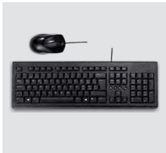
Teclado e Rato