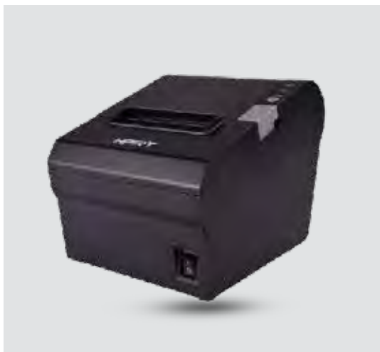
Impressora Termica HPRT