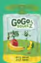
Maçã/Banana Cód. 53114