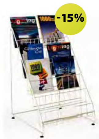
Expositor de Revistas 6 níveis 14547