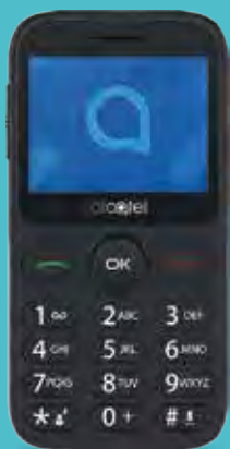
Alcatel 2020 SENIOR €44,99

Código: 53046 Compre por: €19,30 (€/IVA)