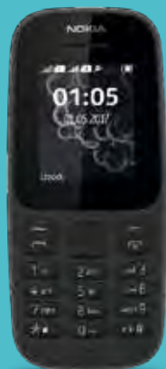
Nokia 105 DS €24,99

Código: 53240 Compre por: €15,44 (€/IVA)