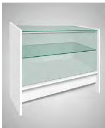
Balcão montra alta

Móvel em aglomerite branca, com tampo e frente em vidro, para exposição. Sem portas na parte de trás. 1000x550x900mm