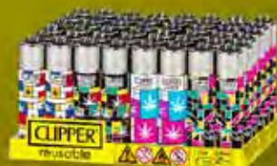
Cód. 501783-72 Modern Weed