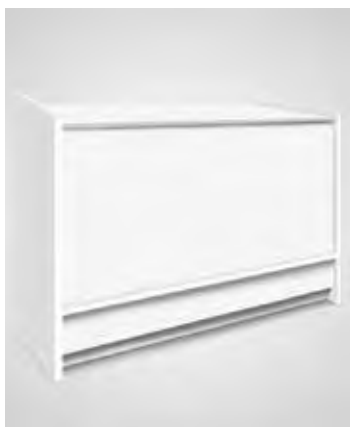
Balcão melamina branca

Interior com 3 prateleiras Sem portas na parte de trás 1000x550x900mm