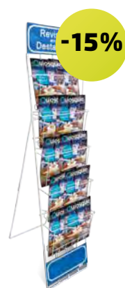
Expositor de Destaque 13909

Fácil de manusear, dá-lhe a possibilidade de destacar as revistas do dia! 340 x 515 x 1530 mm