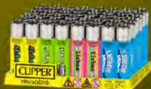
Cód. 501736-96 Lisboa 2023