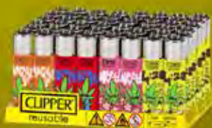
Cód. 501783-71 Weed Bros