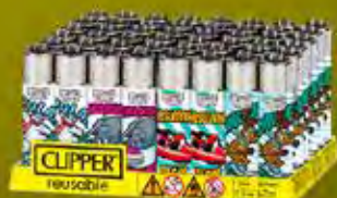
Cód. 501783-73 Winter Mix 4C