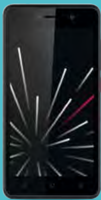
Altecc S24 DS 4G €84,99

Código: 53001 Compre por: €34,75 (€/IVA)