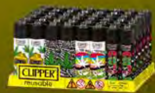
Cód. 501783-77 Weed Time