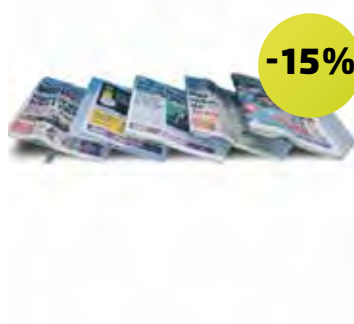
ZigZag Jornais 13905

A forma ideal de expor jornais 970 x 400 x 1000 mm