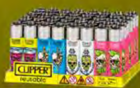
Cód. 501783-76 Bone Portraits