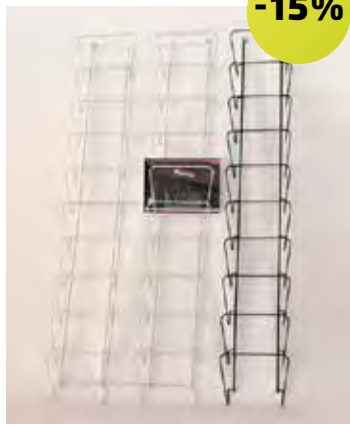
Expositor de parede para jornais Expositor duplo | 3661 550x90x1400 mm