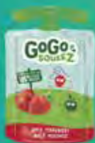
Maçã/Morango Cód. 53114