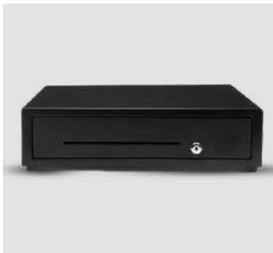
Gaveta de Dinheiro